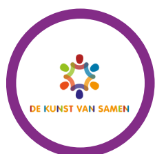
Kunst van Samen