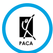
Praktijk Joosten - ergotherapie