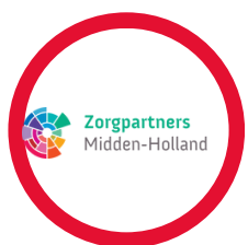
Fysiotherapie Zorgpartners Midden-Holland