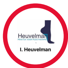
Praktijk voor Podotherapie Heuvelman