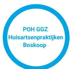
POH GGZ Huisartsenpraktijken Boskoop