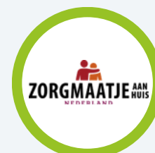
Zorgmaatje aan huis