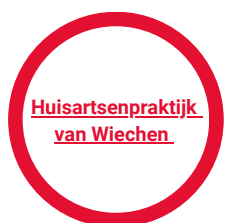
Huisartsenpraktijk van Wiechen