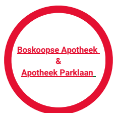
Boskoopse Apotheek & Apotheek Parklaan