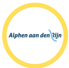
Serviceplein Gemeente Alphen aan den Rijn